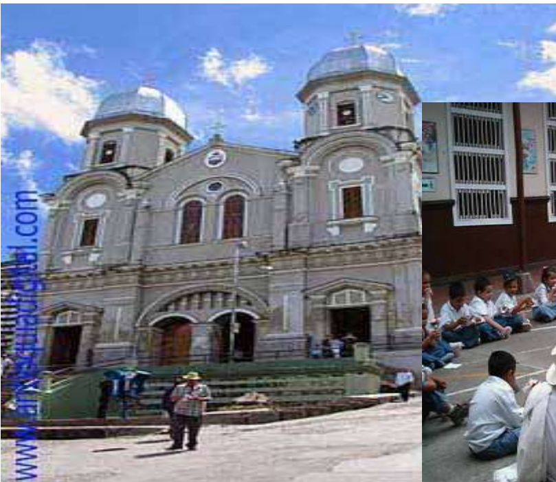
PARQUE DEL MUNICIPIO DE YARUMAL

UNO DE LOS PATIOS DE LA E.N.S "LA MERCED"