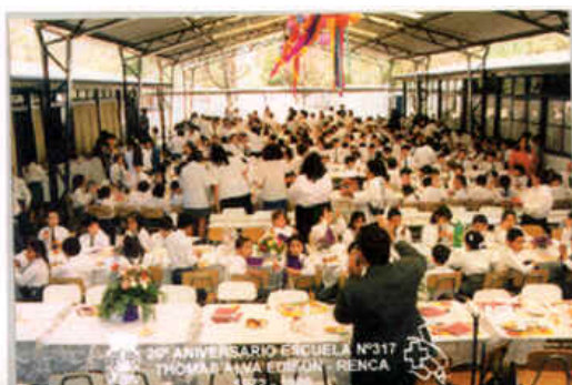
Plan de Estudios Enseñanza General Básica

El Establecimiento Educativo cuenta con un Centro General de padres y apoderados.